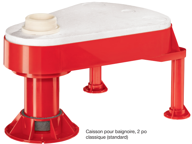
Caisson pour baignoire, 2 po classique (standard)